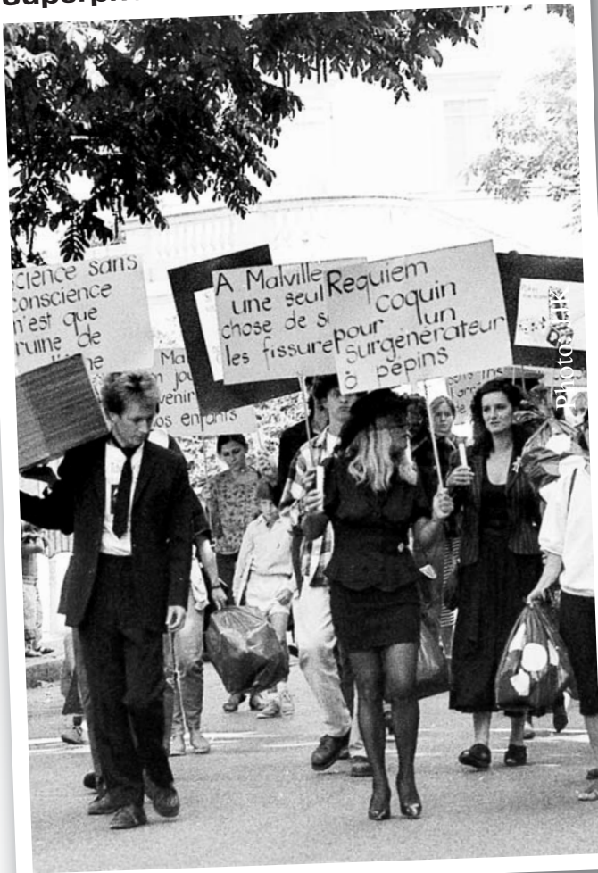
Un des multiples enterrements de Superphenix (dans les années 90-97)